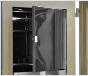
Contalı köpük kapılı kapılar