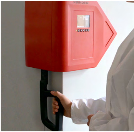
UF V serisi