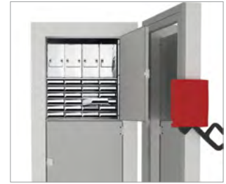
Raf ve kutu seçimi