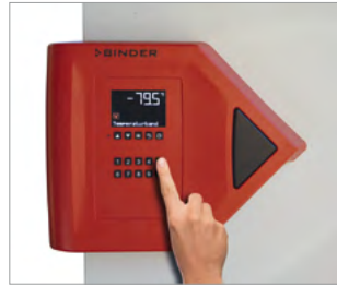
Kapı kilit sistemi